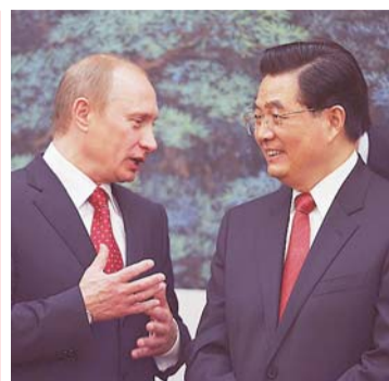
Vladimir Putin în China

Președintele Rusiei, Vladimir Putin, efectuează o vizită oficială în China cu scopul de a promova cooperarea tot mai strânsă dintre cele două țări.