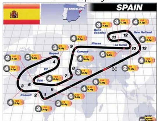
Rubrica realizată de Adrian Popa