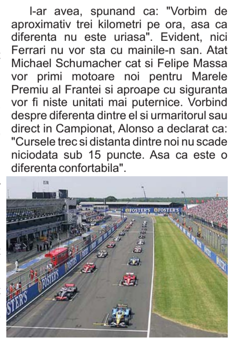
Rubrica de sport realizată de Adrian Popa

Cu doua victorii la activ, dar si cu o infrangere in fata Germaniei, medaliatea cu bronzul Ligii Mondiale la ultima editie, Romania se lupta cu sanse reale pentru calificarea la turneul semifinal de la Portugalete (Spania), rezultat care ar constitui o noua premiera nationala.