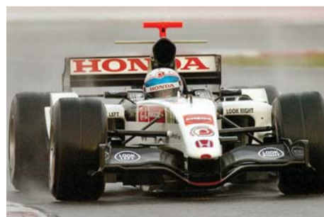
Rubrica de sport realizată de Adrian Popa

Matematic, 72% din campionat s-a dus. Cursele ramase nu sunt multe dar nici putine pentru cele doua echipe si cei doi piloti angrenati in lupta pentru Titluri. Renault pierd puncte de patru curse incoace si inca cinci curse pe acelasi calapod sunt cam multe. Francezii trebuie sa se claseze inaintea echipei din Maranello. Ferrari par in continuare a fi cea mai performanta masina pe uscat si diferentele in clasamentele la Piloti si la Constructori le vor da speranta ca vor deveni din noi Campioni.