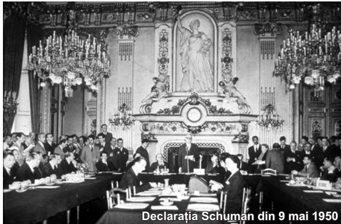
Declarația Schuman din 9 mai 1950

Europa nu se va construi dintr-o dată sau ca urmare a unui plan unic, ci prin realizări concrete care vor genera în primul rând o solidaritate de fapt. Alăturarea națiunilor europene implică eliminarea opoziției seculare dintre Franța și Germania. Orice acțiune întreprinsă trebuie să aibă în vedere în primul rând aceste două țări.