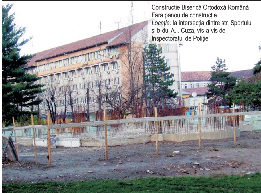
Construcție Biserică Ortodoxă Română Fără panou de construcție Locație: la intersecția dintre str. Sportului și b-dul A.I. Cuza, vis-a-vis de Inspectoratul de Poliție