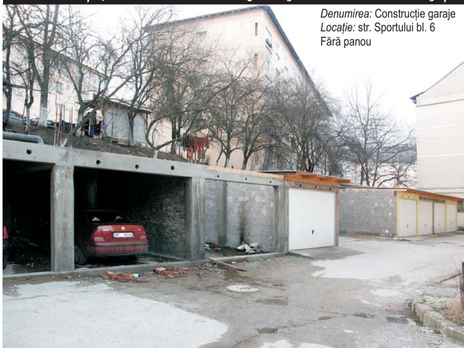
Denumirea: Construcție garaje Locație: str. Sportului bl. 6 Fără panou