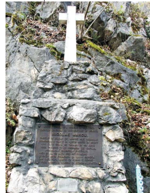
Monumentul Eroului jandarm Nicolae Marcu mort la datorie la data de 14 iunie 1919

03.04.2010: Ziua Jandarmeriei Române. La Reșița, cei 160 de ani de la înființarea Jandarmeriei au fost marcați printr-o serie de competiții sportive între cadrele Jandarmeriei, onoruri militare precum și o demonstrație a căinilor salvatori.