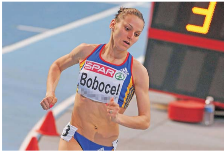
Programul sportivilor romani in primele doua zile ale competitiei:

Alina Dumitru vrea să-și păstreze titlul. Campioană olimpică în 2008, la Beijing, judoka Alina Dumitru va încerca să-și apere titlul. Alina se numără printre favoritele la categoria 48 de kilograme și poate aduce prima medalie de aur României la JO de la Londra, ea urmând a concura sâmbătă, chiar în prima zi de concurs.