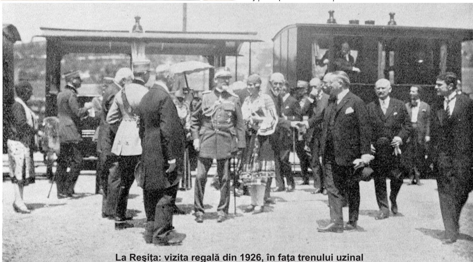
La Reșița: vizita regală din 1926, în fața trenului uzinal

Un astfel de eveniment special îl reprezintă și cel codificat sub denumirea „1-40-140”, dedicat aniversării a 140 de ani de la fabricarea primei locomotive cu abur românești la Reșița și împlinirii a 40 de ani de la inaugurarea expoziției de locomotive în aer liber ce constituie, astăzi, patrimoniul celui mai mare muzeu tehnic în aer liber din Europa - MLA Reșița - un proiect al Fundației UDR.