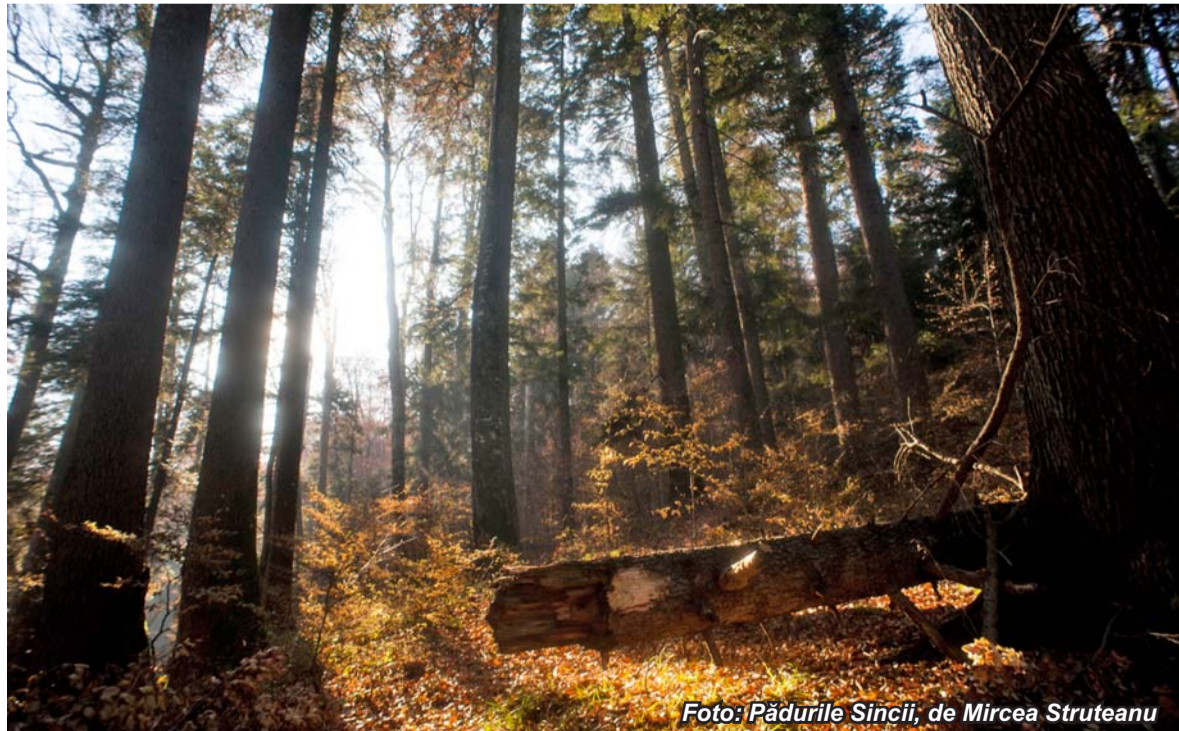
Foto: Pădurile Sincii